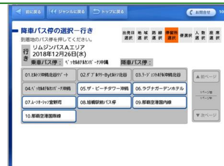
希望する降車バス停のボタンをタッチします。