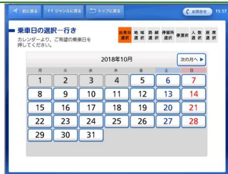
希望する出発日のボタンをタッチします。