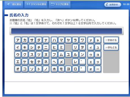
乗車する方の名前を入力し、「次へ」ボタンをタッチします。