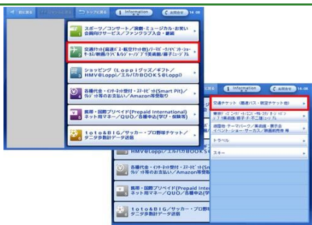
上段から2段目「交通チケット(高速バス・航空チケット他)/テーマパーク」ボタンをタッチします。続けて「交通チケット(高速バス・航空チケット他)」ボタンをタッチします。