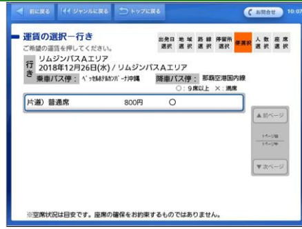
希望する運賃のボタンをタッチします。