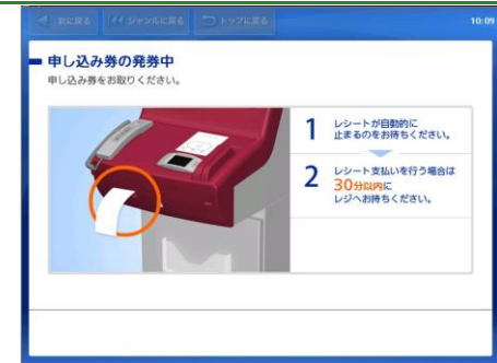
Loppiから「申し込み券」が印刷されます。 レジでは現金にてお支払をします。