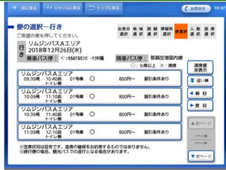
希望する便のボタンをタッチします。