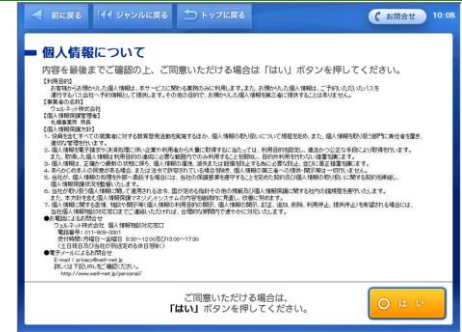
個人情報の取り扱いについて確認していただき、同意していただける場合は、「はい」ボタンをタッチします。