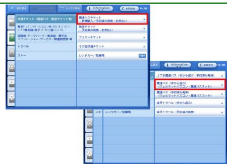
「高速バスチケット新規購入/予約済み発券・お支払」ボタンをタッチします。続けて「高速バス(今から選ぶ)ウェルネットバスコン・高速バスネット」ボタンをタッチします。