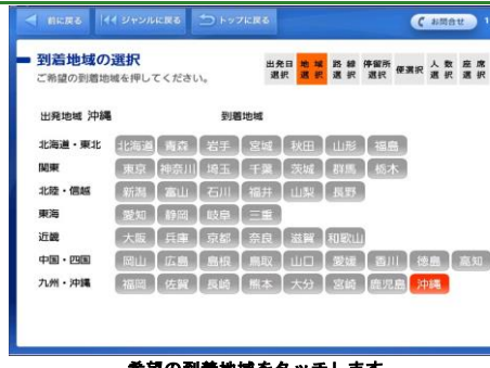
希望の到着地域をタッチします。