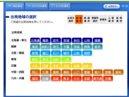
希望の出発地域をタッチします。