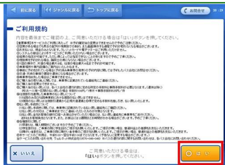
利用規約について確認していただき、同意していただける場合は「はい」ボタンをタッチします。