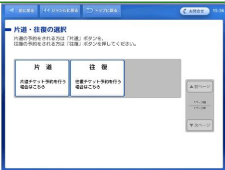
片道/往復の何れかを選択して、予約される方のボタンをタッチします。