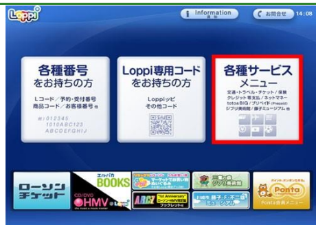
Loppiのトップ画面から『各種サービスメニュー』ボタンをタッチします。