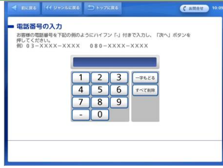
電話番号を入力し、「次へ」ボタンをタッチします。