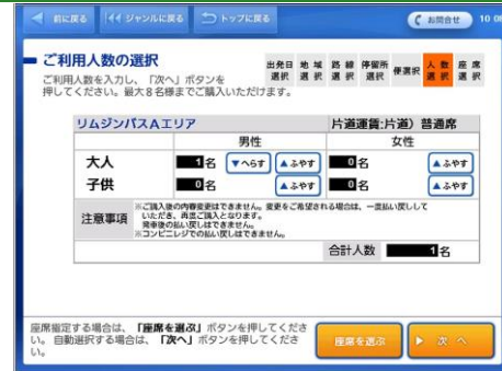
チケットを予約する人数(枚数)を入力し、「次へ」ボタンをタッチします。 ※画面上に「座席を選ぶ」ボタンがある場合は座席の指定が行えます。