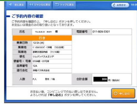
予約内容を確認し、間違いがなければ「申し込む」ボタンをタッチします。