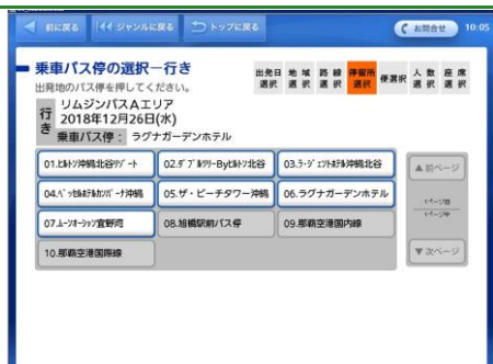
希望する乗車バス停のボタンをタッチします。